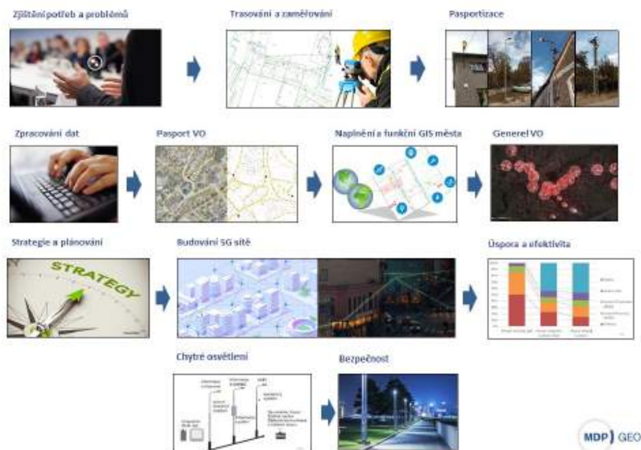
Obrázek 11: Postup zavedení Smart City do veřejného osvětlení