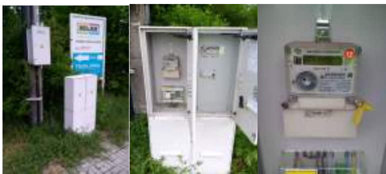
Obrázek 5: Celkový pohled, detail rozvaděče a elektroměr