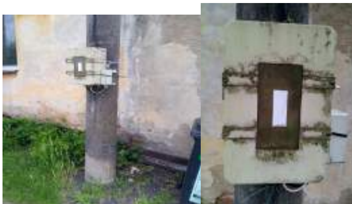
Obrázek 10: Celkový pohled a detail rozvaděče