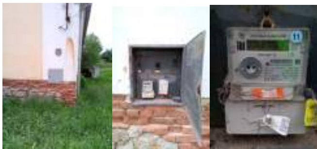
Obrázek 6: Celkový pohled, detail rozvaděče a elektroměr