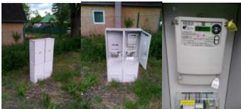
Obrázek 4: Celkový pohled, detail rozvaděče a elektroměr