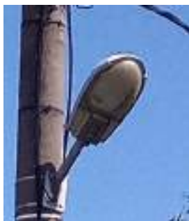
Typ 1 - MALAGA PHILIPS 70W : 27 ks