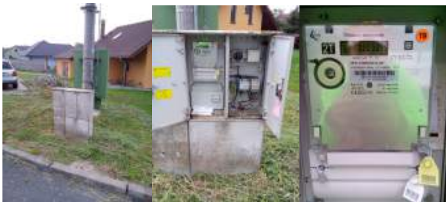
Obrázek 2: Celkový pohled, detail rozvaděče a elektroměr