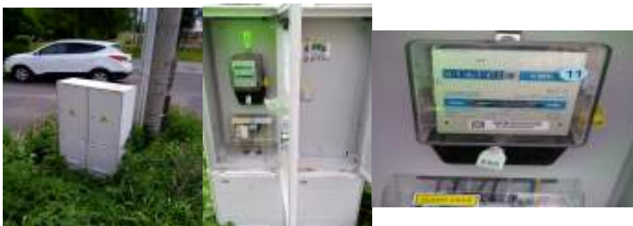
Obrázek 7: Celkový pohled, detail rozvaděče a elektroměr