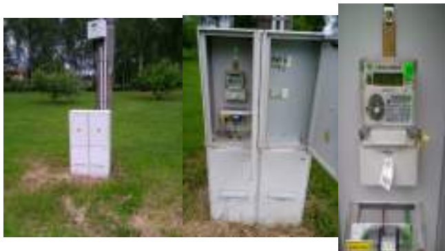
Obrázek 8: Celkový pohled, detail rozvaděče a elektroměr