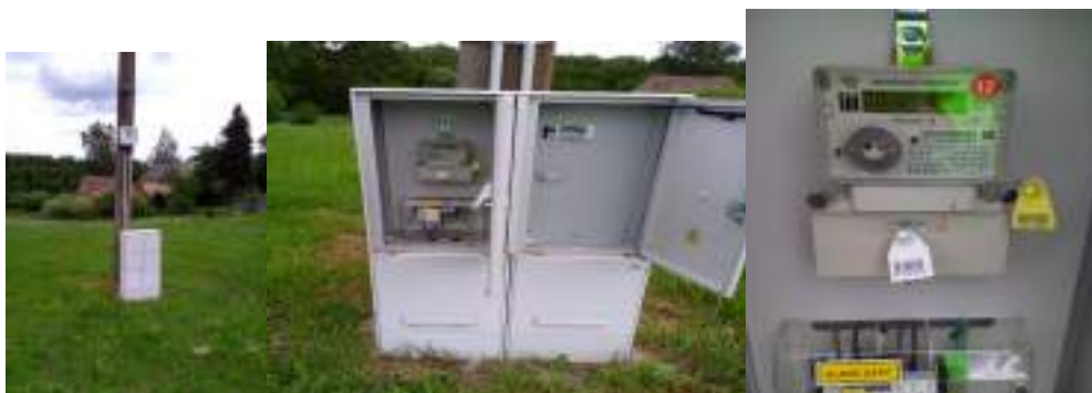
Obrázek 9: Celkový pohled, detail rozvaděče a elektroměr