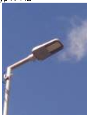
Typ 7: 4 ks