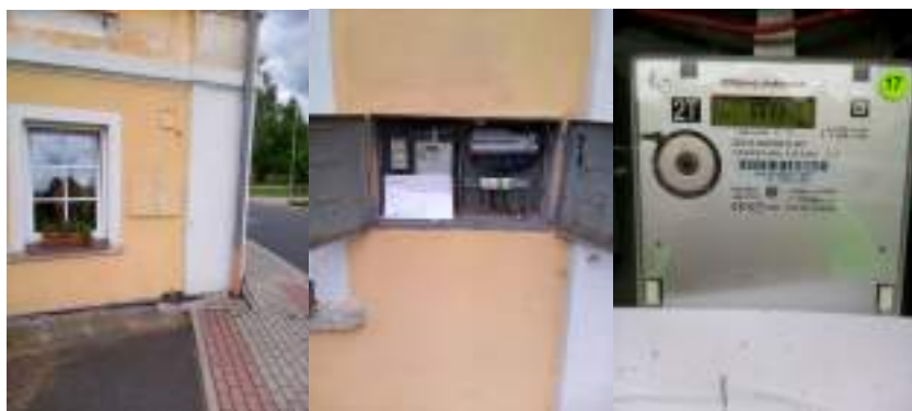
Obrázek 1: Celkový pohled, detail rozvaděče a elektroměr