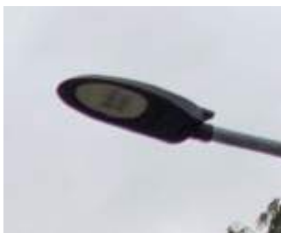
Typ 5: 29 ks