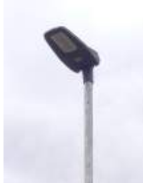
Typ 8: 54 ks