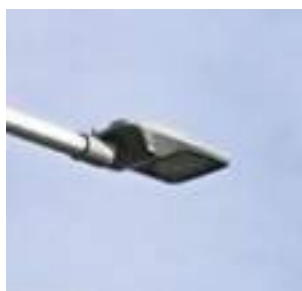
Typ 4: 8 ks