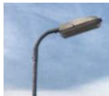
Typ 3 - LV 236 MODUS : 6 ks