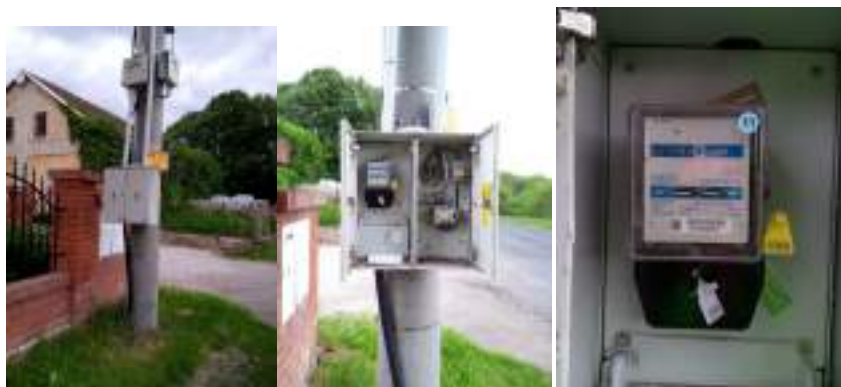
Obrázek 3: Celkový pohled, detail rozvaděče a elektroměr